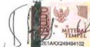
Intan Salsabilla Usrevi