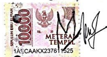
(Mutia Tri Gusni)