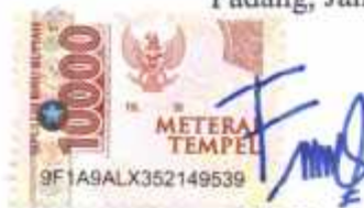
Fuji Depitalya, S.Kep